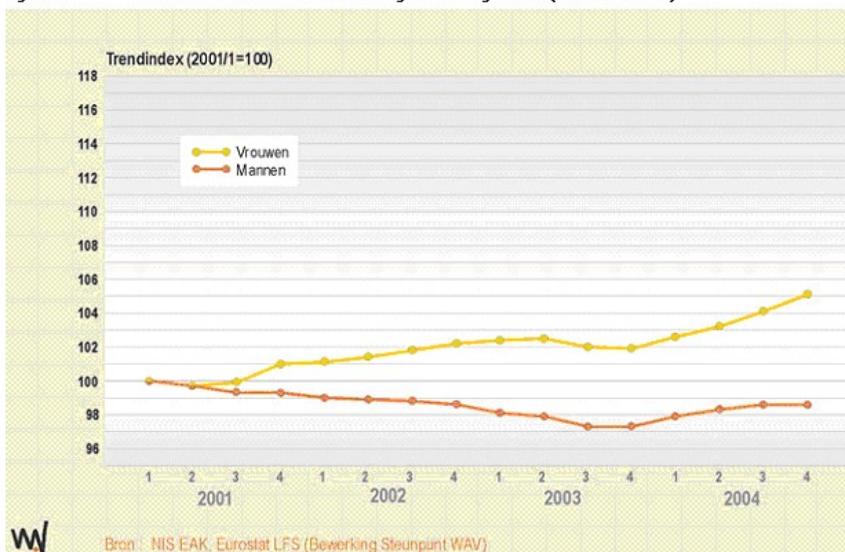
Figuur 1. Trendniveau van de werkzaamheidsgraad naar geslacht (Vlaams Gewest)

Tussen het eerste kwartaal van 2001 en het vierde kwartaal van 2004 steeg het trendniveau van de werkzaamheidsgraad bij de vrouwen van 54% naar 56,7% en bij de 55-plussers van 25,1% naar 29,5%. Ondanks de sterke groeiprestaties blijven de ouderen en de vrouwen echter nog steeds sterk achter op de gemiddelde werkzaamheidsgraad van 64,3%. Vooral bij de 55-plussers is de Europese norm van 50% werkenden nog lang niet in zicht. De primaire uitdaging voor de deelnemers aan het eindeloopbaan debat bestaat er dan ook in om - tegen de achtergrond van een conjunctuurverzwakking - de voorwaarden te scheppen om minstens het huidige groeiritme aan te houden.