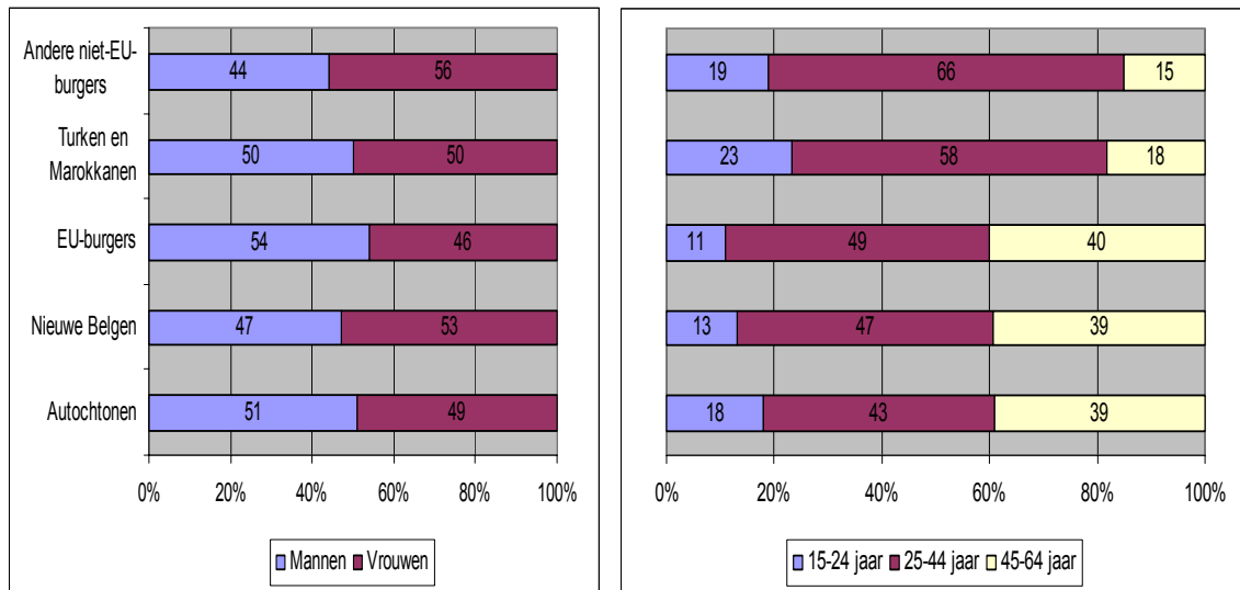
Figuur 1. Verdeling van de totale bevolking (15-64 jaar) naar nationaliteit, geslacht en leeftijd (Vlaams Gewest; 2003-2004)